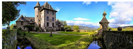
Château de Vixouze