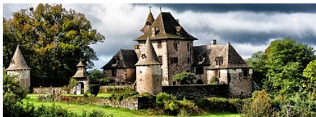
Château de Vixouze

Ensemble architectural prestigieux et naturel qui se prête volontiers au décor et à l'ambiance de vos manifestations les plus diverses. Surplombant le village de Polminhac entre Aurillac et Vic-sur-Cère, il veille jalousement sur son domaine, dont les premières fondations portent fièrement leurs 1000 ans d'âge. De ce que nous connaissons, l'histoire commence ainsi : C'est en 923 que Bernard II, Vicomte de Carlat, donne Vixouze à l'Abbaye de Conques. A l'origine existait un donjon de défense et d'observation de la Vallée de la Cère qui, après destruction partielle au moyen âge, fut reconstruit. Sous le règne de Saint Louis, Vixouze était avec Pesteil et Foulholes -aujourd'hui disparues- les seules forteresses de la Vallée de la Cère. Le château fut ensuite remanié au XVe, XVIIe et XVIIIe. Ce sont les Pagès de Vixouze qui sont à l'origine de grandes transformations. La façade fut éventrée pour y pratiquer des ouvertures, la tour d'escalier adjointe, les deux ailes et l'enceinte furent édifiées. Construction du long corps de bâtiment XVIIIe qui encercle le donjon (35mètres de long), suppression de la deuxième enceinte. La fontaine et le porche sont du XVIIIe. Trois grandes familles ont possédé Vixouze. Elles se sont illustrées par l'épée, par la plume et dans la magistrature : les Vixouze, les Pagès de Vixouze et les Dessauget d'Auliac.